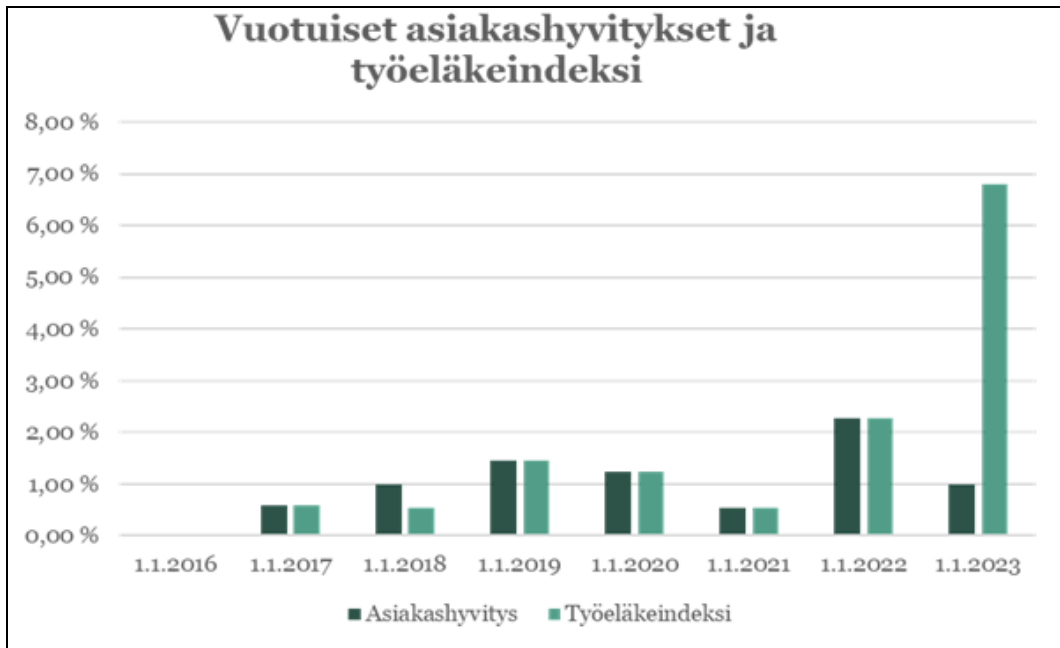
Kuva 2. Vuotuiset asiakashyvitykset ja Työeläkeindeksi.